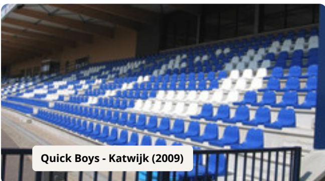
Quick Boys - Katwijk (2009)